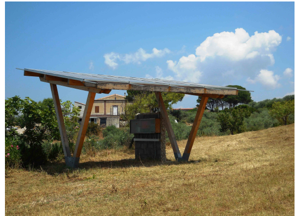
Le energie rinnovabili